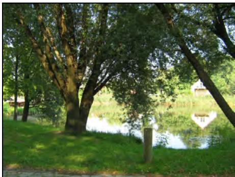
Blick Richtung Osten