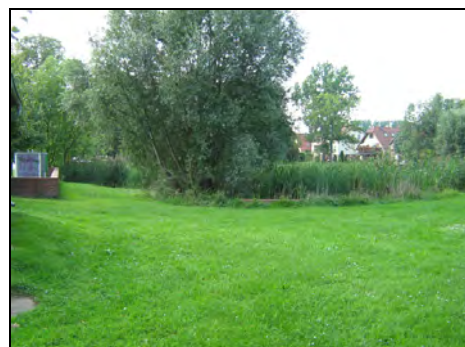
Blick von Südosten