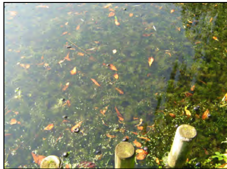
Laubeintrag und Hornblattbesiedelung, defekte Ufersicherung