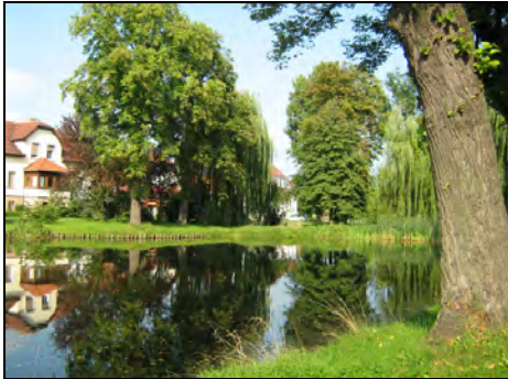
Blick auf nördliches Ufer