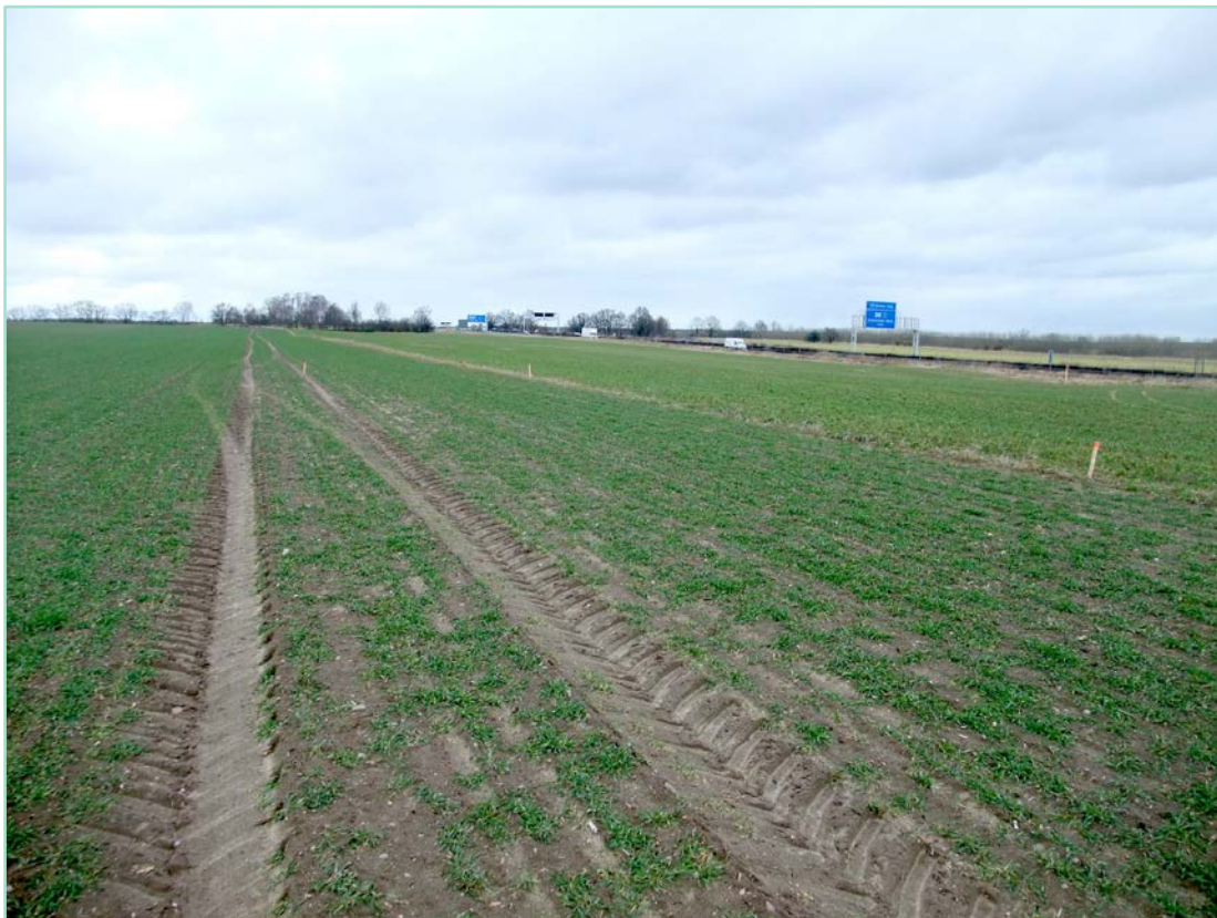
Untersuchungsfläche Gewerbegebiet Ragow.

Die zu bewertende Fläche liegt nordwestlich der Anschlussstelle Ragow / Königs Wusterhausen an der BAB 13. Die BAB 13 grenzt nahezu direkt an das Untersuchungsgebiet. Die Planfläche ist eine landwirtschaftliche Nutzfläche und auch die direkte Umgebung wird großräumig intensiv landwirtschaftlich genutzt. Erst in deutlichem Abstand sind im Norden Feldgehölze und im Westen ein kleines Wäldchen zu erkennen.